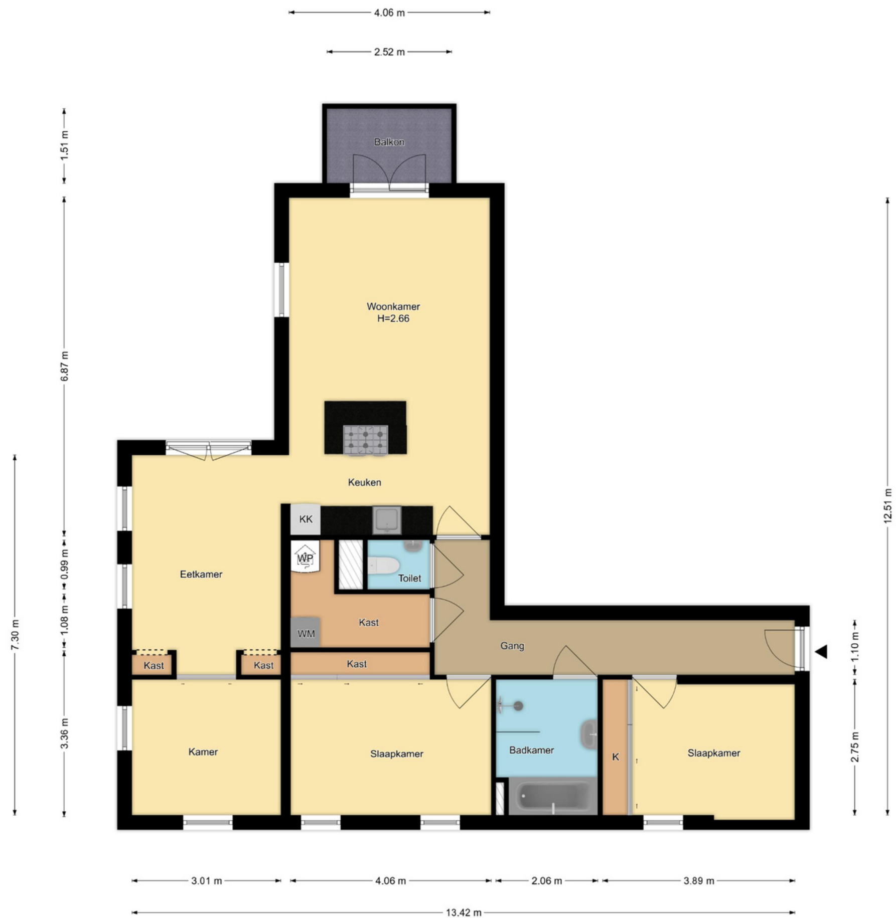
1e Verdieping Maria Tundorhof 14, Hoofddorp

R.M. Vastgoedpresentatie| Aan deze plattegrond kunnen geen rechten worden ontleend