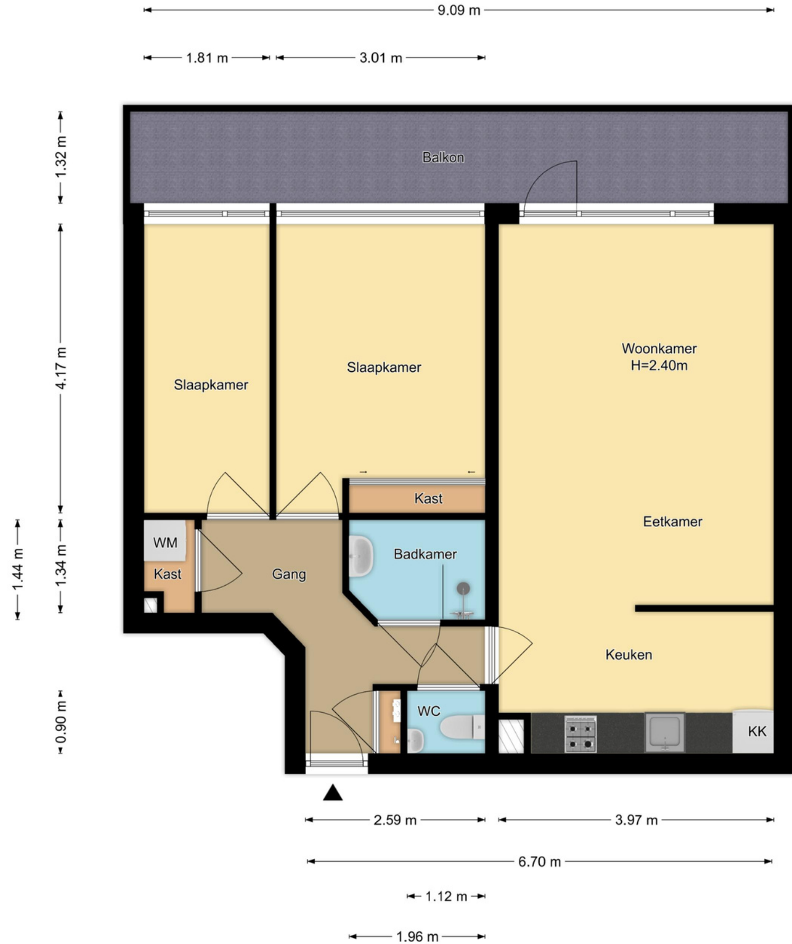
1e Verdieping Stationsplein 17 - F8, Zandvoort

R.M. Vastgoedpresentatie | Aan deze plattegrond kunnen geen rechten worden ontleend