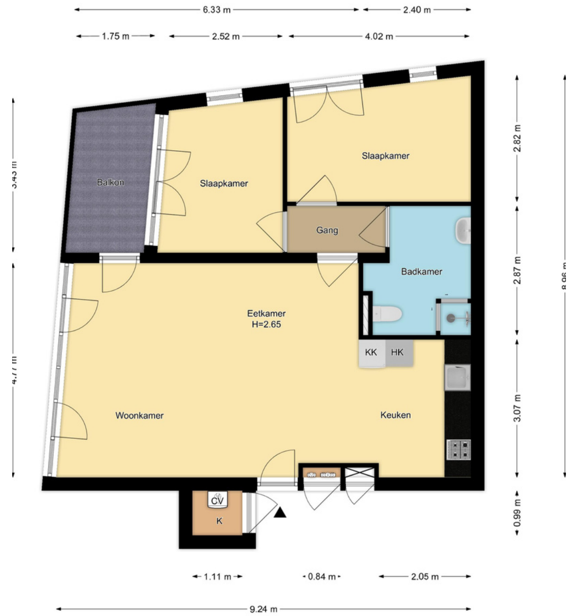
1e Verdieping Essenstraat 9c, Haarlem R.M. Vastgoedpresentatie| Aan deze plattegrond kunnen geen rechten worden ontleend